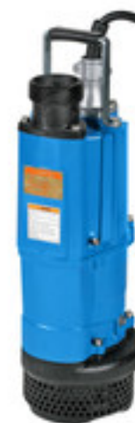
Compact - monophasé - 2,2kW

4 rue Lavoisier . ZA Lavoisier . 95223 HERBLAY CEDEX Tel. : 01.39.97.65.10 / Fax. : 01.39.97.68.48 Demande de prix / e-mail : service-commercial@motralec.com www.motralec.com