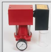
Servo moteur avec vanne gaz pour branchement sur ordinateur.

Le système plus petit MS 20, est livré comme régulateur séparé et détendeur à monter séparément avec un servomoteur. Sur ce système 1 à 3 appareils peuvent être branchés.