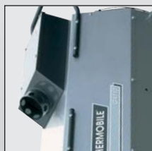
Panneau de contrôle comportant tous les composants sensibles à l'épreuve de l'humidité et de la poussière, avec prise extérieur d'air de combustion.