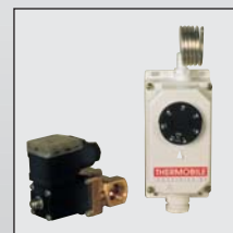
Système pour protection anti-incendie pour séchage des produits de récolte.