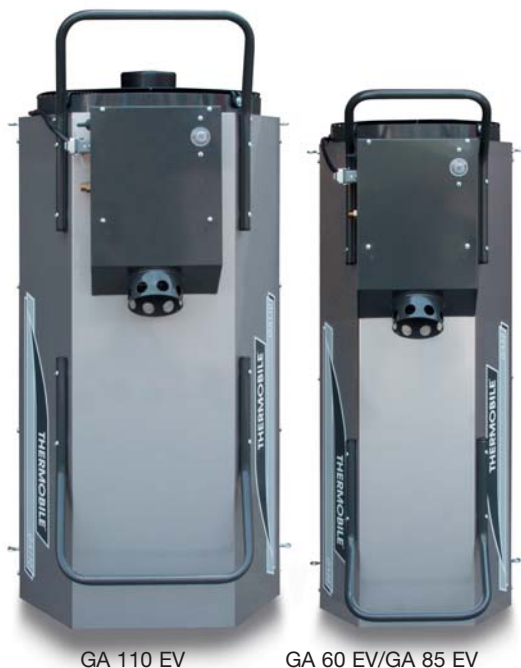
GA 110 EV