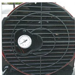
Manomètre de pression.