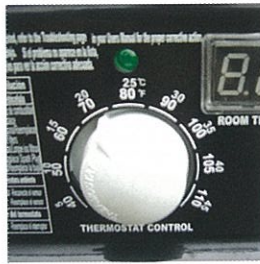
Thermostat intégré avec indicateur de température digital.