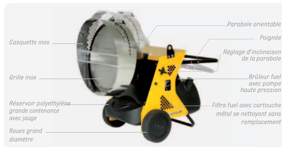
Tableau de commande avec prise de thermostat d'ambiance.