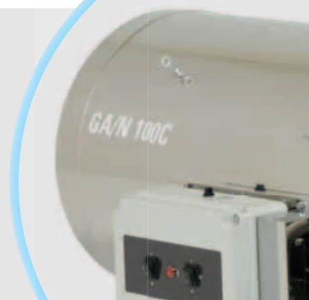
Armoire électrique étanche