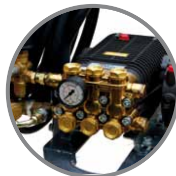
Pompe / Pump / Pumpe COMET

RÉDUCTÉE Reduction gear Untersetzungsgetriebe