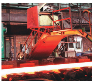
Métallurgie (Laminoin à chaud)