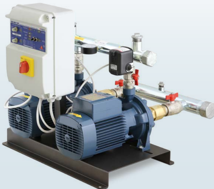
CB2 - 2CP