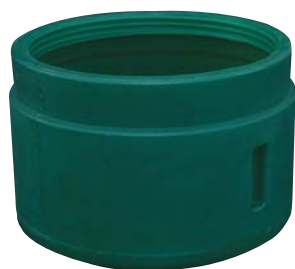
Réhausse 0,30 m