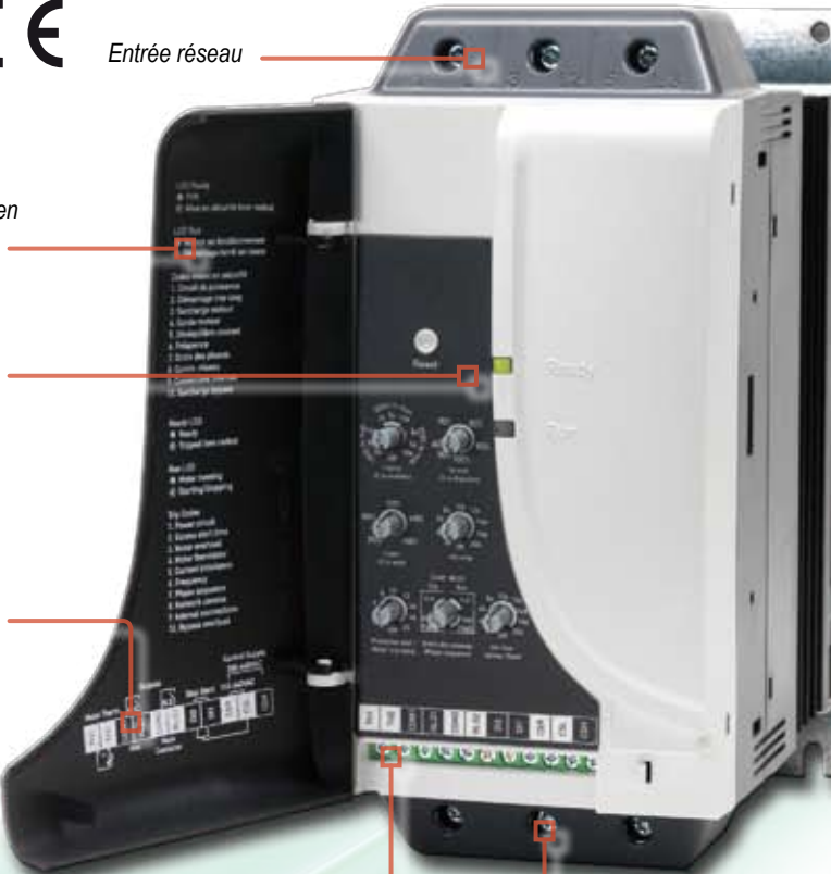
Schéma de raccordement du contrôle