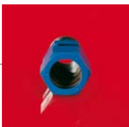
Raccordement fileté par gaz G et NPT.