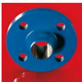
Brides DIN Brides ANSI Brides JSI.

Une adaptation spécifique pour une intégration selon le souhait du client est possible.