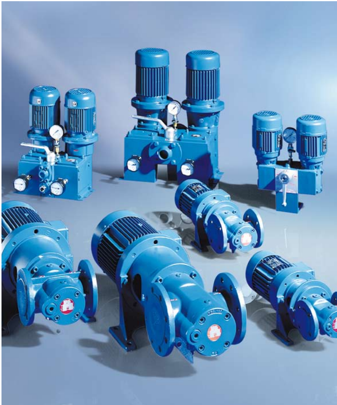
Sélection des séries K et DL/DS.