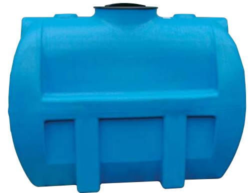
Réservoir horizontal : RS 1300