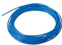
Câble spécial 1,5 mm2 pour électrode