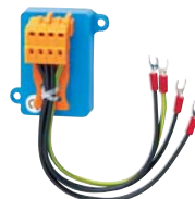
Parasurtenseur PS 3