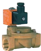
Electrovanne ESM 86 24 V ou 230 V