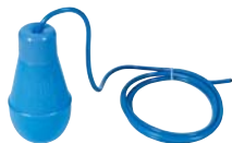
IFB Régulateur de niveau