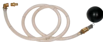
Kit d'aspiration 1" pour cuve enterrée Code 355251

Appareil destiné à la filtration des eaux domestiques. Possibilité de purger le filtre pour éliminer les impuretés.