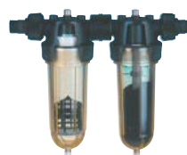
Filtre NW 25 DOUBLE Code 506090

Collecteur et filtre universel s'installant facilement sur le bas des descentes de gouttière. Rejette les impuretés (feuilles, mousses...) par l'avant et alimente en eau de pluie la cuve GLOBUS.