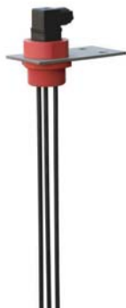
Sonde de présence liquide