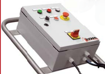
Tableau électrique CE avec inverseur