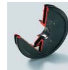
Clapet spécial d'amorçage