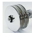
Turbines en acier inoxydable

Flasques aspiration et refoulement en laiton pour des eaux agressives ou récupération d'eau de pluie.