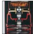
Double garniture mécanique