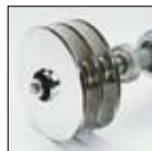
Turbines en acier inoxydable