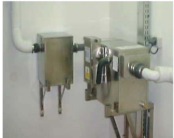
Paris Restaurant Apollo PSD + D3/2 - 400 crts