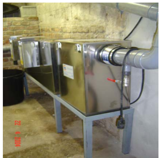
Indiana Bastille PSD+D5/3