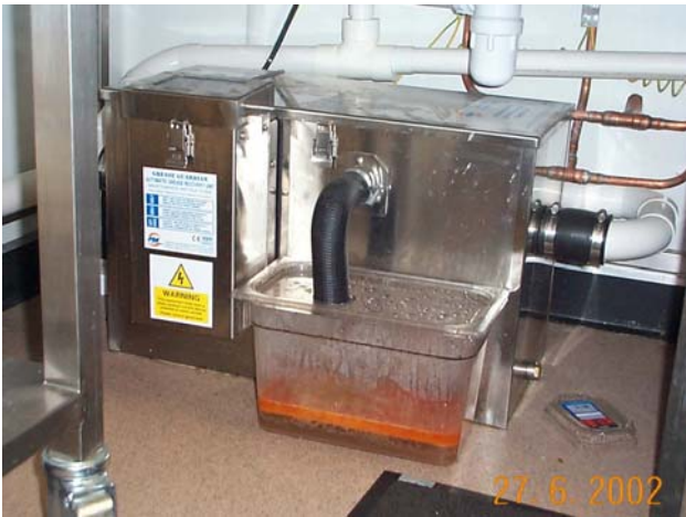
Installation sous plonge