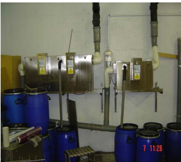
MK2 Bibliothèque D 5/3 + D 3/2 – capacité totale 1800 crts