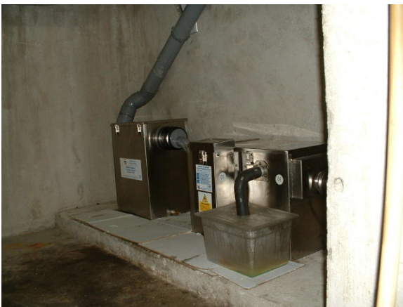
Le Scossa, Paris , PSD + D 3/2 – 40 crts