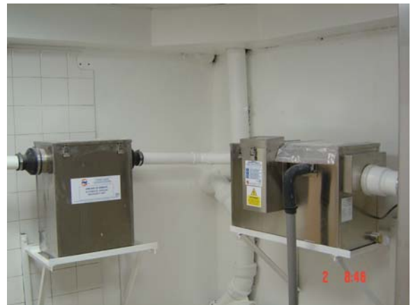
La Strasbourgeoise Paris – 400 crts D 3/2 + PSD