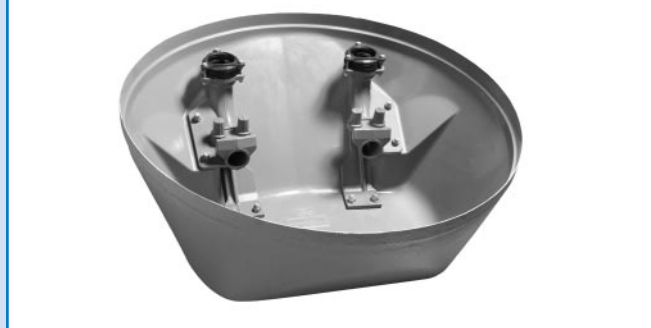
Fond autonettoyant avec pieds d'assise inclinés équipés du système multijoint

L'ensemble des équipements est optimisé pour rester performant dans le temps.