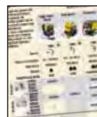
Tableau de sélection pompes et flexibles

Pour une vitesse et des performances optimales, voir le tableau de sélection pour clés dynamométriques, pompes et flexibles.