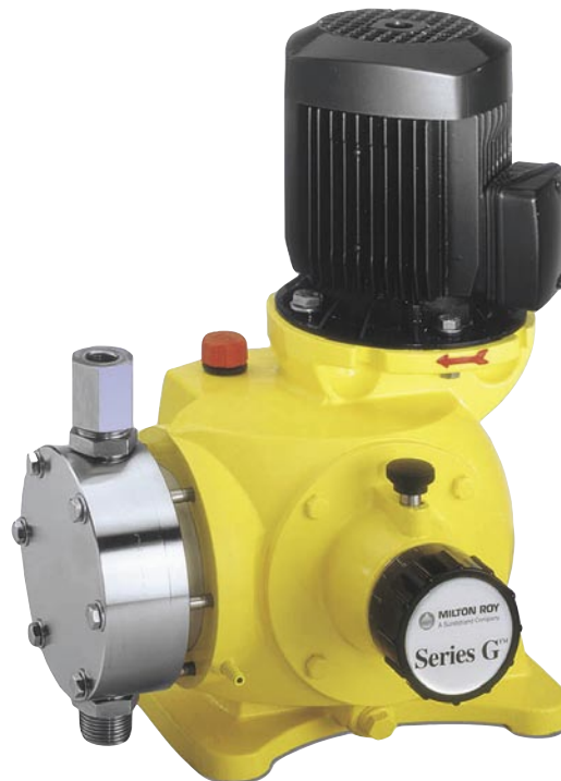
Pompe doseuse série G™ B

(2) Au-delà de 590 l/h : 3 m de colonne d'eau