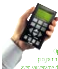
Option clavier de programmation universel avec sauvegarde des paramètres.

Réseaux de terrain (Profibus 3 et 12 Mb, DeviceNet et AS(i)). Interrupteur triphasé pour coupure amont ou aval du FCD. Bornier de raccordement externe des entrées/sorties déportées. Logiciel de programmation et de mise en service.