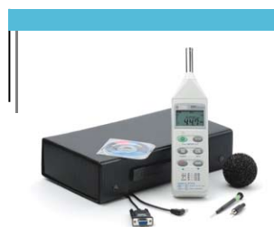
Le sonomètre-enregistreur C.A 834 et ses accessoires