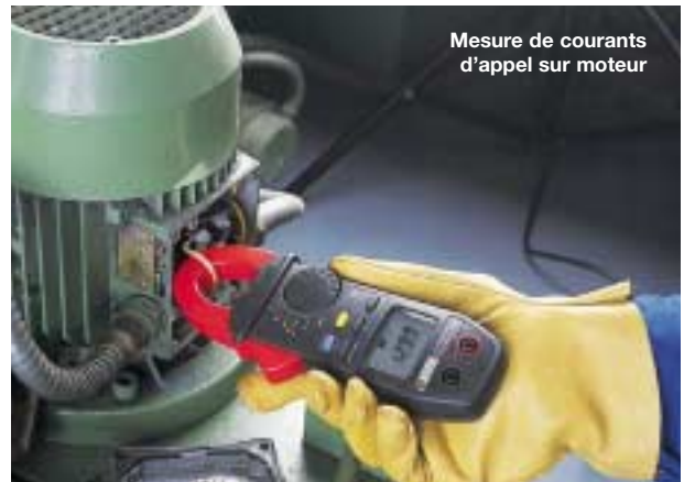
Mesure de courants d'appel sur moteur

Un fort appel de courant peut déclencher les systèmes de sécurité, voire endommager l'installation. La fonction "Inrush current" mesure l'évolution du courant de démarrage moteur, sans nécessité de visualisation graphique, et définit les relations amplitude-temps de la protection moteur.