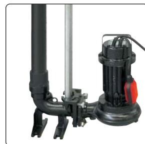
Exemple : CAL 740 - 75HMPA

Réhausse : Réhausse hauteur 250 mm - Référence : RC 250