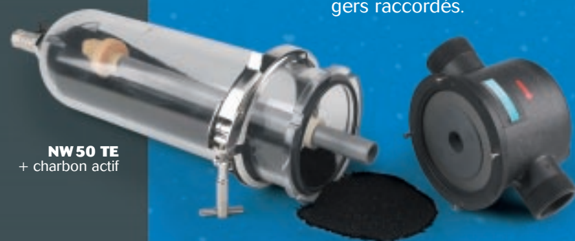
NW 50 TE + charbon actif