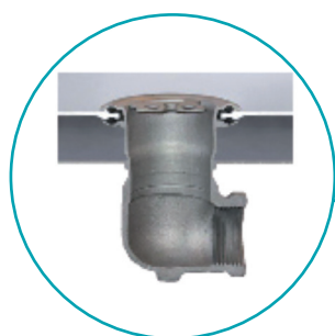
Raccordement de l'eau en acier inoxydable