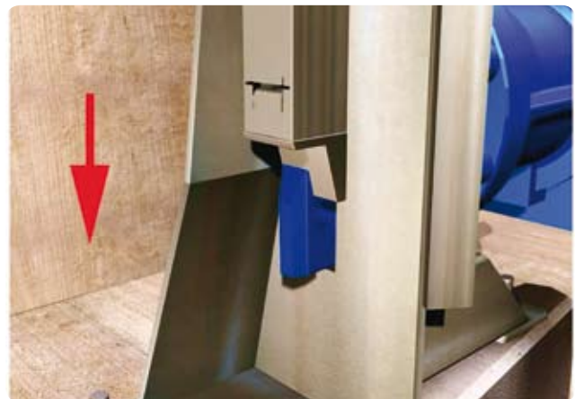
Système de verrouillage