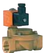
Électrovanne ESM 86 24 V ou 230 V