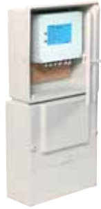
ARMOIRE CSR 2

Choix des pompes (voir notice technique pompe choisie)