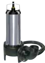
SÉMISOM Série 65

Se montent dans la COLLECTIFOS PO 2000/2500 DN50 - DSD