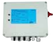
COFFRET BSR 2