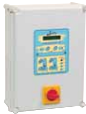
COGITUM II R

Les COLLECTIFOS fonctionnent obligatoirement avec un coffret électrique pour 2 pompes.