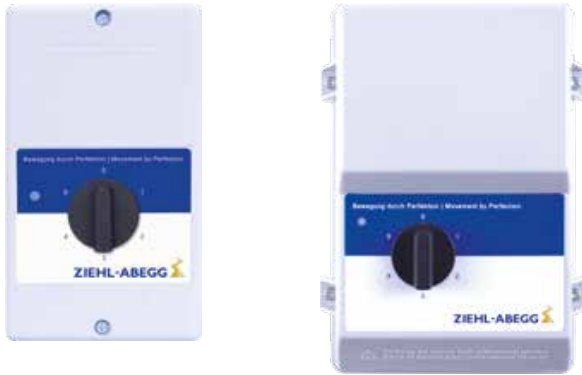
Tranformer based controllers 1~ with 5- step-switch 1~ 230V 50/60Hz