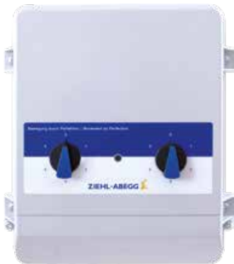
Transformer based controllers 1~ with two 5-step-switch, two speeds external changing 1~ 230V 50/60Hz

1~ with two 5-step switches, two speeds can be externally switched