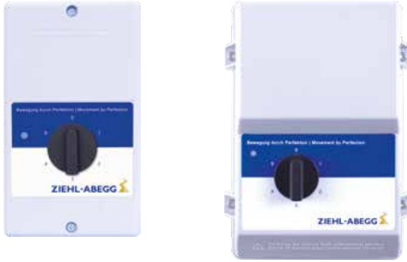
Tranformer based controllers 1~ with 5- step-switch 1~ 230V 50/60Hz