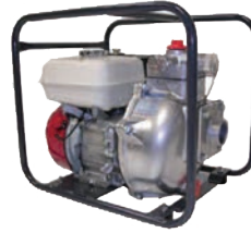
TEF3 50 HA