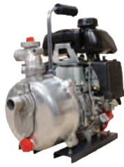
TEF 25 HA