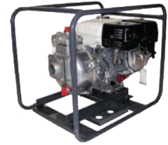
TEW2 50 HA