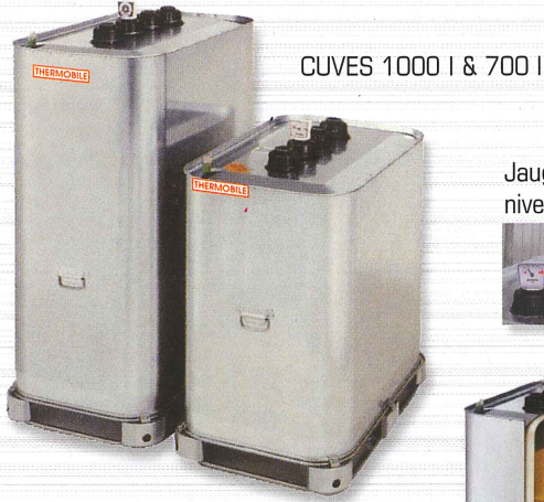
Jauge de niveau