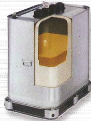
Zone de rétention intégrée

Les cuves à fioul mobiles intérieures (homologuées) et extérieures avec bac de rétention sont composées d'une enveloppe intérieure en polyéthylène soufflé (HDPE) sans soudure et d'une paroi métallique extérieure totalement soudée. La zone de rétention peut recevoir 100 % du liquide déversé en cas de fuite.