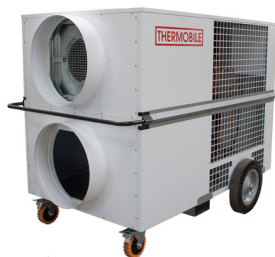
COOLMOBILE C 8 / CR 17 M