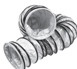
Gaine blanc et bague