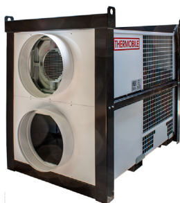
COOLMOBILE CR 17 S