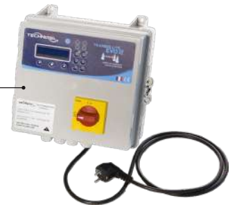
Coffret de protection, d'alarmes et de gestion