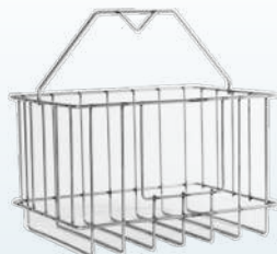
Panier de dégrillage en option