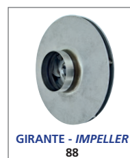
GIRANTE - IMPELLER 88