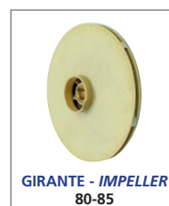
GIRANTE - IMPELLER 80-85