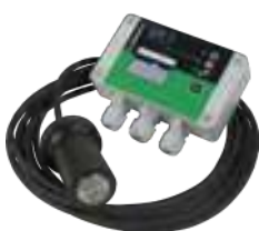
Alarme graisse 230 V sonde/coffret