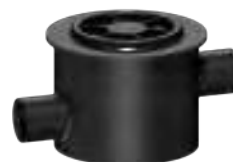
Dispositif de prélèvement DN 150

HYDRO-00100 3308815090757 Compatible avec les tailles 7, 10 et 15