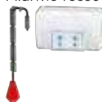
Alarme fosse filaire

SANIFOSALARM 3308815081625 Pour la version 1 pompe