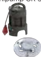
Roue dilacératrice Pro X K2