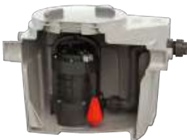
Sanipump GR S