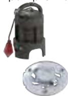
Roue dilacératrice Pro X K2