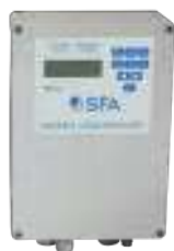
Coffret de commande ZPS 2