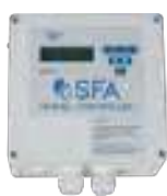
Coffret de commande ZPS 1