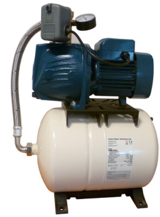
GW-FRESH avec réservoir «CHALLENGER» (livré monté et câblé)