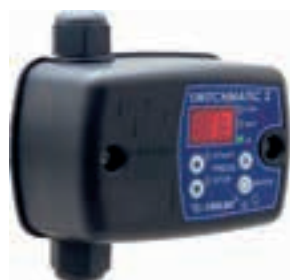
SWITCH MATIC 2 M