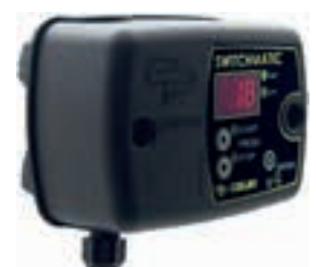
SWITCH MATIC 3