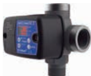
T-KIT SW 2 M