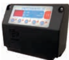
SWITCH MATIC 2 T