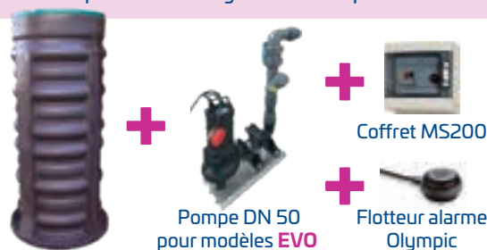
Pompe DN 50 pour modèles EVO Coffret MS200 Flotteur alarme Olympic