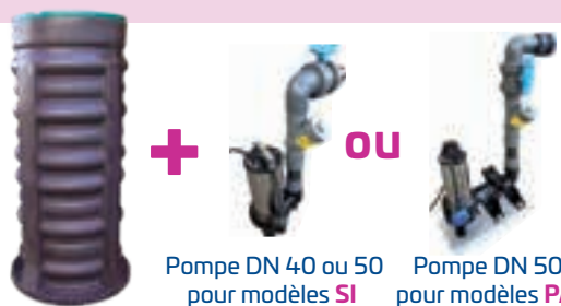
Pompe DN 40 ou 50 pour modèles SI ou Pompe DN 50 pour modèles PA