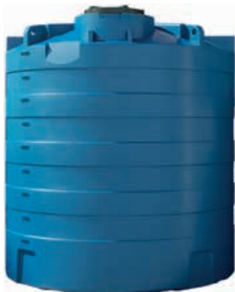
CEP 10 000